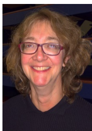
P T ASD' HOMME